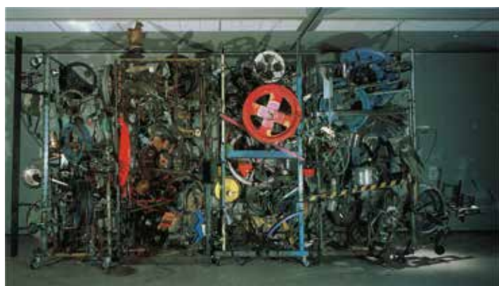
左上から： ジャスパー・ジョーンズ《標的》(1974) © Jasper Johns / VAGA at ARS, NY / JASPAR, Tokyo, 2022 G2912 ジョアン・ミロ《夜の中の女たち》(1946) © Successió Miró / ADAGP, Paris & JASPAR, Tokyo, 2022 G2912 ジャクソン・ポロック《No.9》(1950) / イヴ・クライン《海綿レリーフ (RE50)》(1958) ロイ・リキテンシュタイン《赤ワインのある静物》(1972) © Estate of Roy Lichtenstein, New York & JASPAR, Tokyo, 2022 G2912 ジャン・ティンゲリー《地獄の首都No.1》(1984) © ADAGP, Paris & JASPAR, Tokyo, 2022 G2912